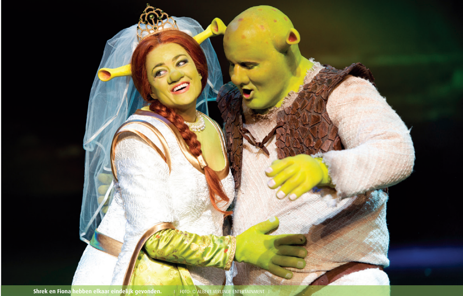
Shrek en Fiona hebben elkaar eindelijk gevonden.