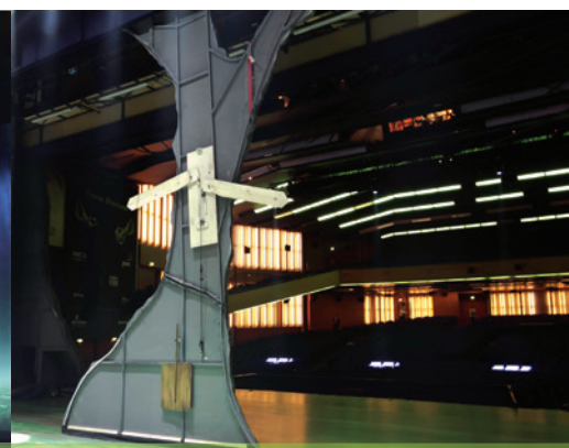
Een van de grote bomen van twee kanten bekeken.