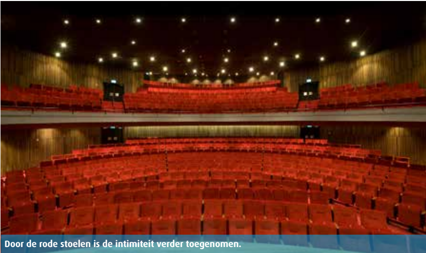
Door de rode stoelen is de intimiteit verder toegenomen.

direct naar huis ging. Als je beneden de grote zaal verliet, kwam je in een lage sfeerlose ruimte met een donker plafond en het eerste wat je zag was je jas in een hele lange lelijke garderobe en de uitgang. Als je nu de kleine of de grote zaal uitgaat, kom je als vanzelf in de stadsfoyer. De mooiste plek van de schouwburg. De grote glazen pui was aan het zicht onttrokken door de trap naar de kleine zaal. Nu staat er een lange bar het publiek welkom te heten. Ik vind de combinatie van de industriële, harde, natuurlijke materialen met de inrichting heel geslaagd. De stalen bars, glazen balustrades, cementbetonnen pilaren, Gispstoelen, de houten vloeren en plafonds geven een warme uitstraling. Het is een moderne plek geworden zonder dat het er te design, urban of hip uitziet.' Om deze stadsfoyer tot stand te brengen zijn de oorspronkelijke buitenmuren weggehaald waardoor de ruimte beneden nu helemaal open is. De schuifdeuren, die veel kou binnenlieten, zijn vervangen door een tourniquet zodat je er behaaglijk kunt zitten.