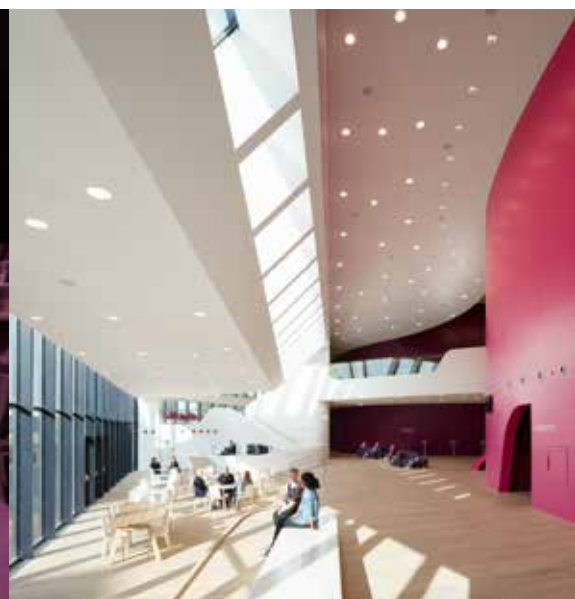
De beweegbare klankkaatsers in de grote zaal, met ledspots, verbergen de lichtbrug. Rechts de foyer.