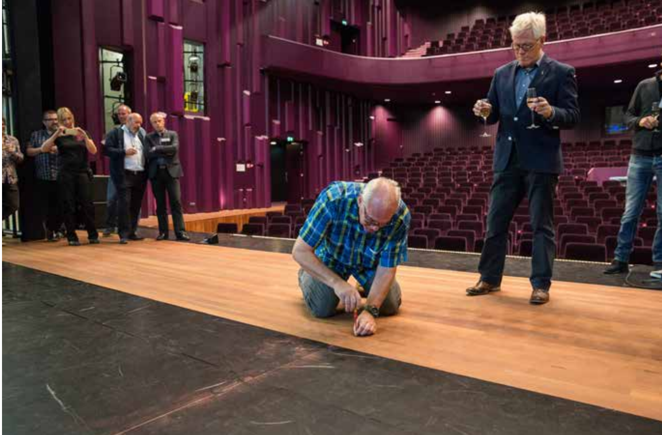
Koperen Kees wordt aangebracht tijdens de rondleiding op 22 september.

achterdoek is voorzien van wieltjes en kan zo met licht en al zakken en naar een andere positie worden gereden. En nog een detail: rondom het toneel zijn in meerdere lagen buizen aanwezig om bijvoorbeeld