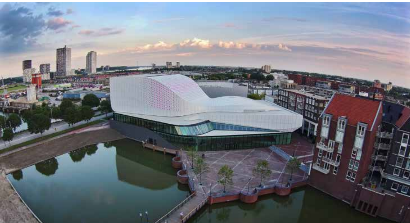
Het beperkte perceel voor het nieuwe theater is ten volle benut.

bele kleine zaal met 200 stoelen op een inschuifbare tribune. Verder zijn er 13 kleedkamers, 3 foyers, 1 artiestenfoyer en nog eens 3 vergaderruimtes. Alle kantoren bevinden zich boven het kassagebied, alleen die van de techniek liggen vlakbij het podium van de grote zaal.