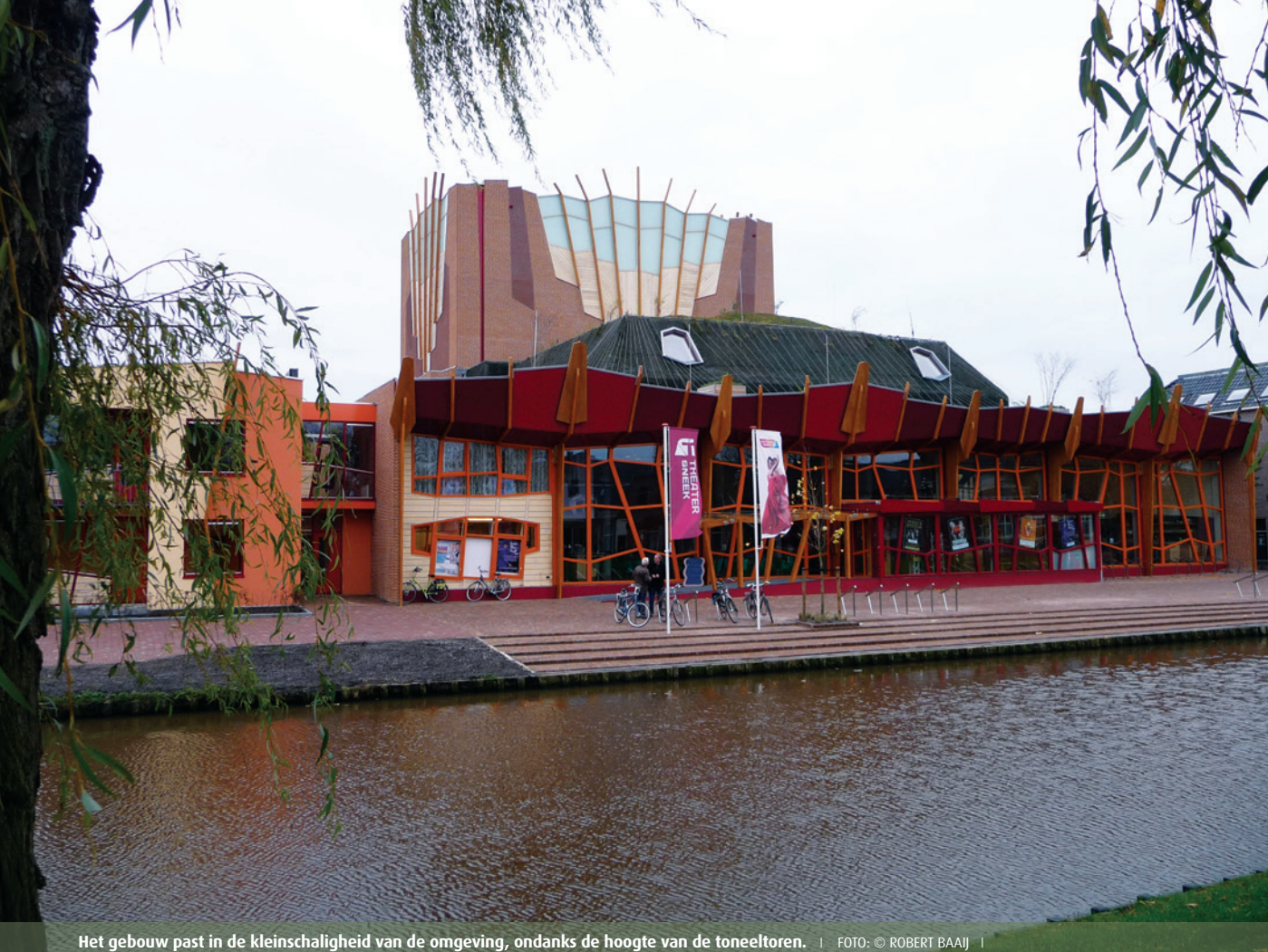
Het gebouw past in de kleinschaligheid van de omgeving, ondanks de hoogte van de toneeltoren.

van een drempelloos gebouw daadwerkelijk is ingelost. De enige drempel die ik tegenkwam was bij een kleine patio die als rokersruimte is ingericht. De kans dat dáár een vleugel heen moet, lijkt mij te verwaarlozen.