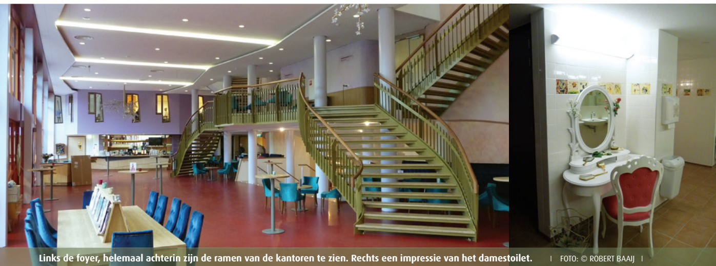
Links de foyer, helemaal achterin zijn de ramen van de kantoren te zien. Rechts een impressie van het damestoilet.