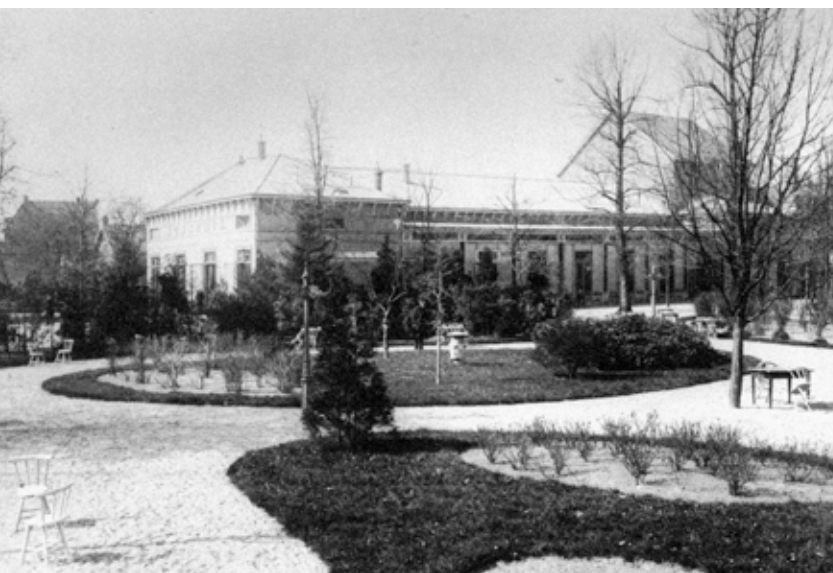
Sociëteit Kunstmin (1850)

Vereniging Kunstmin wordt opgericht in 1849 en heeft dan vier afdelingen: vocale en instrumentale muziek, beeldende kunst en retorica. Alle leden beoefenen zelf een van deze kunsten en je moet auditie doen om lid te kunnen worden.