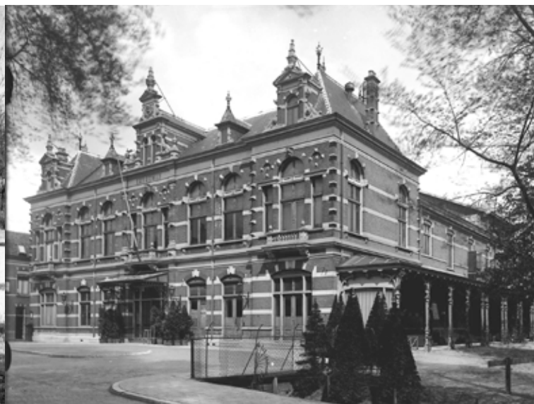
Concertzaal Kunstmin (1892)