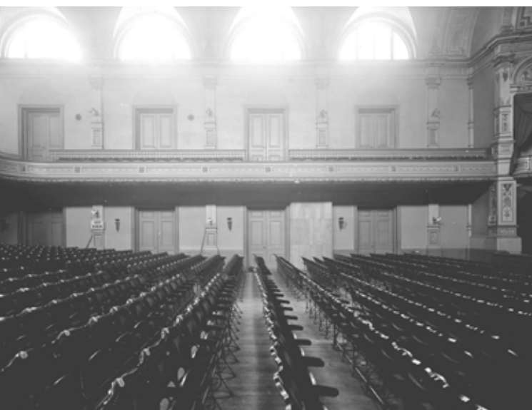
Concertzaal Kunstmin, interieur