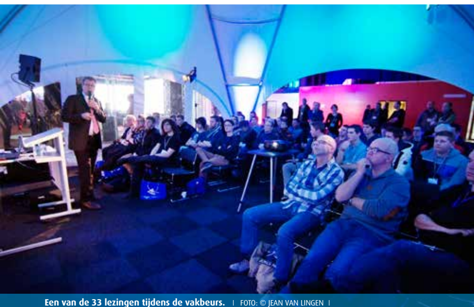
Een van de 33 lezingen tijdens de vakbeurs.