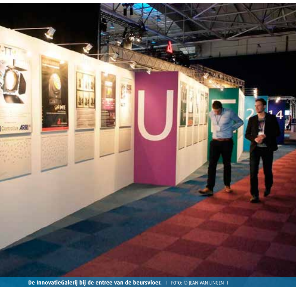
De InnovatieGalerij bij de entree van de beursvloer.

Iedereen kan tevreden terugkijken op CUE2014. De bezoekers vanwege het grote aanbod aan nieuwe producten en interessante presentaties en lezingen. De exposanten vanwege de grote belangstelling. En de organisatie omdat de beurs een professionele uitstraling had, lekker druk was en in een ontspannen sfeer verliep. CUE trok dit jaar 5.515 bezoekers, tien procent