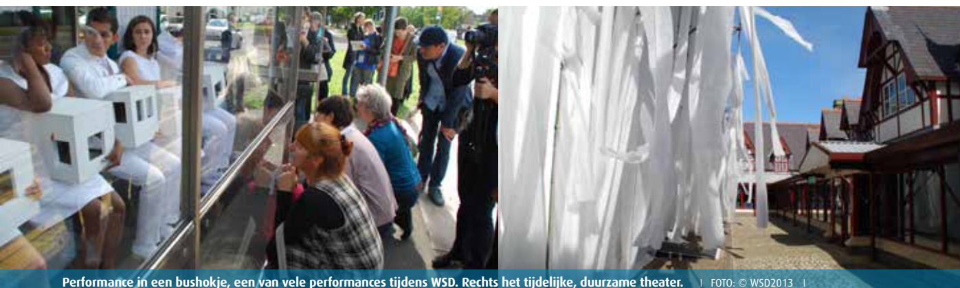
Performance in een bushokje, een van vele performances tijdens WSD. Rechts het tijdelijke, duurzame theater. | FOTO: © WSD2013 |

centrum in Afrika! - te ondersteunen. Om dezelfde reden kwam men bijeen op de Filipijnen. Dit soort 'ontwikkelingshulp' wil OISTAT bieden aan theaterculturen die wel een zetje kunnen gebruiken. Door de support van goede initiatieven vanuit het internationale OISTAT-netwerk krijgt een nationale organisatie vaak meer (politiek) draagvlak. Het Filipijnse OISTAT-centrum heeft zich bijvoorbeeld kandidaat kunnen stellen voor de organisatie van WSD2017. Uit het immer lijvige boekwerk met de vergaderstukken blijkt dat OISTAT redelijk stabiel is. De internationale organisatie wordt vanuit Taiwan degelijk geleid, met subsidie van de regering aldaar. Op kantoor heeft een wisseling van de wacht plaats gevonden: Wei Weng Chen heeft als Executive Director (coördinator) plaats gemaakt voor Kathy Hong. Die stap heeft ►