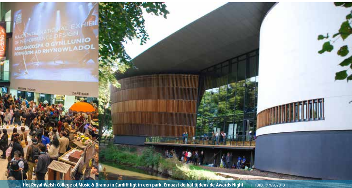
Het Royal Welsh College of Music & Drama in Cardiff ligt in een park. Ernaast de hal tijdens de Awards Night.

de muziek, het weer en de politiek. Tijdens het OISTAT-congres schemert door dat de PQ-organisatie de hele opzet voor 2015 gaat veranderen. Het Tsjechische Theaterinstituut is van plan om de landeninzendingen te tonen in allerlei ruimtes verspreid over het centrum van de stad. Een reden voor die spreiding is ongetwijfeld dat de oude locatie, het deels in as gelegde Industriële Paleis, ook in 2015 nog niet beschikbaar zal zijn. Een andere reden is vermoedelijk dat de subsidieverstrekkers eisen dat de PQ meer zichtbaar wordt voor de Praagse bevolking. Dat is natuurlijk een legitieme gedachte, maar kan wel de functie van de PQ als internationale ontmoetingsplek danig ondermijnen. Ook werd gemeld dat de PQ niet meer het OISTAT-congres zal faciliteren. Dat hoeft op zich niet zo'n probleem te zijn. In het