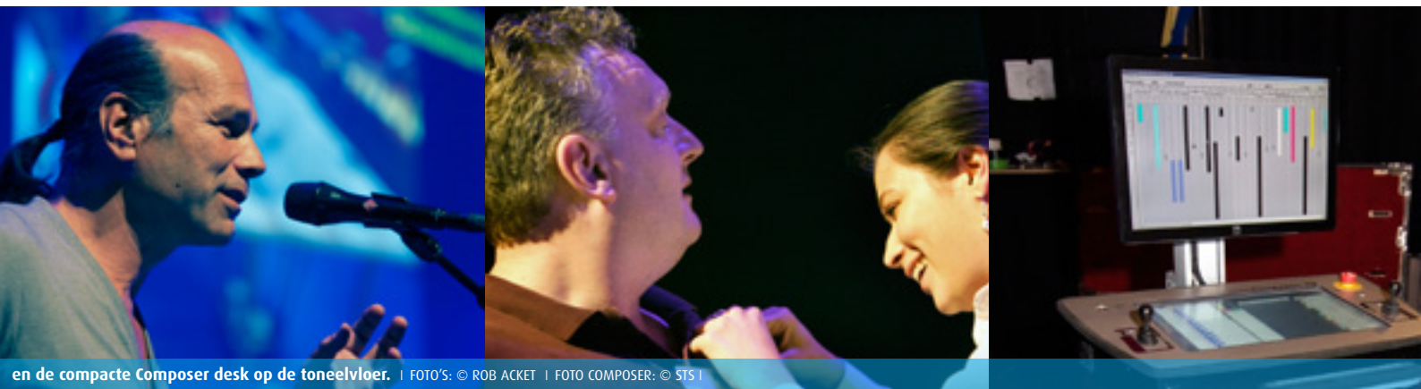
en de compacte Composer desk op de toneelvloer. | FOTO'S: © ROB ACKET | FOTO COMPOSER: © STS |

gebruik van een processor, 60 versterkerkanalen en 150 luidsprekerkanalen (uiteraard onzichtbaar). Hiermee is nagalm mogelijk voor klassieke muziek, het systeem kan ondersteuning bieden aan 'zachte solisten', en het is ook nog een surround systeem voor theater en film (met Dolby Digital specificatie). Al die functies kunnen tegelijk worden benut.