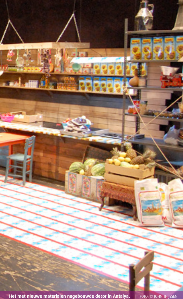
Het met nieuwe materialen nagebouwde decor in Antalya.