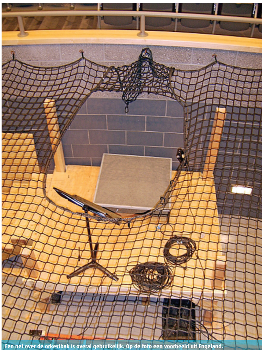
Een net over de orkestbak is overal gebruikelijk. Op de foto een voorbeeld uit Engeland.