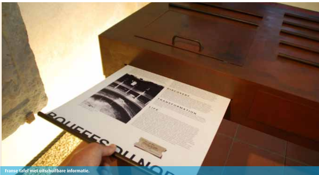
Fransen tafel met uitschuifbare informatie.

satelliet het routeverloop bijhoudt en op bepaalde plekken opdrachten geeft, foto's laat zien of teksten activeert (later hoor ik dat bij de start van de PQ het gps-sig-naal in Praag niet altijd goed doorkwam op de gebruikte smartphones, waardoor 7scenes de locatie niet kon bepalen. Met de aanschaf van de nieuwste iPhones is dat opgelost). Na de drukte van het museum is het even wennen aan de rust buiten, in een gewone Praagse buurt. De concentratie die de smartphone vraagt maakt dat je de omgeving extra goed in je opneemt. Daardoor sta je open voor het verhaal dat via beeld, geluid en opdrachten tot je komt. Vooral het zelf foto's maken, met ergens in je achterhoofd de fotograaf van de gevonden foto's en zijn