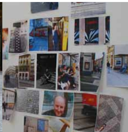
Tijdens de stadswandeling door deelnemers gemaakte foto's in het Nederlandse paviljoen.

ties en een licht- en geluidshow. Dit Tingueliaanse objecttheater vertelt het verhaal van een scheepsramp met een enorme rijkdom aan beelden en letterlijke gelaagdheid. Het ziet er allemaal erg 1.0 uit maar is 2.0 gemaakt. Erg boeiend, dit theater zonder acteurs. De Servische inzending, een tip die ik kreeg van Marloeke van der Vlucht, bestaat uit een serie hologrammen van bijna perfecte kwaliteit. Het 3D-effect is zeer overtuigend en levert door het soort filmpjes ook meerwaarde, zoals een acteur/danser die je ziet rondklimmen in een spinnenweb van touw. Ook leuk is een deel van de Canadese inzending: een podium dat bestaat uit tientallen beweegbare vloerdelen die onafhankelijk van elkaar kunnen bewegen, maar dan op schaal gemaakt voor poppentheater.