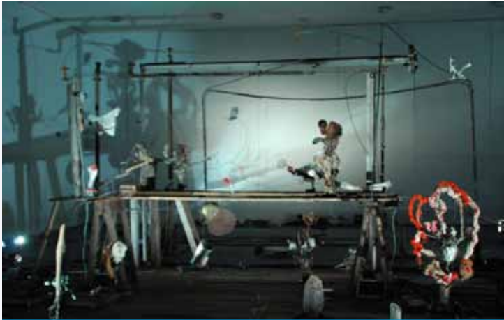
Het technische theater van de Noren.