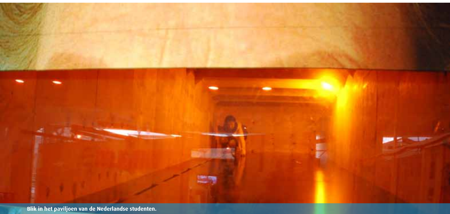
Blik in het paviljoen van de Nederlandse studenten.