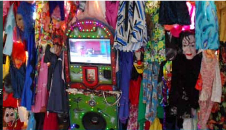
Veelkleurige kleding met in het midden videobeeld, in het Colombiaanse paviljoen.

paar dat uiterst geconcentreerd en gepassioneerd de tango danst, twee mensen in een etalage in een serene, liefdevolle omhelzing. Of een vrouw gekleed in witte vodden die met de bezoeker een soort choreografie uitvoert in haar met afgedankte witte kleding ingerichte doos. Het is van een verstilde eenvoud en laat door de een-op-een interactie met het publiek een blijvende indruk achter. Ook de meer op pure scenografie geïnspireerde installaties, zoals van de beroemde Duitse scenograaf Anna Viebrock, zijn spannend en van hoge kwaliteit. Elke uitgenodigde vormgever, theatermaker of kunstenaar heeft zichtbaar diep nagedacht wat te doen met de paar vierkante meter in de doos en is vrijwel altijd met een inventief idee gekomen. Niemand heeft de doos volgestouwd met een overzicht van werk, iedereen heeft zich geconcentreerd op iets specifiek, op het veroorzaken van een ervaring bij de toeschouwer. Van dit goed vormgegeven theaterdorp ben ik tijdens de PQ het meest onder de indruk geraakt. Wat mij betreft is dit 'bijprogramma' een voorbeeld voor de nationale inzendingen.