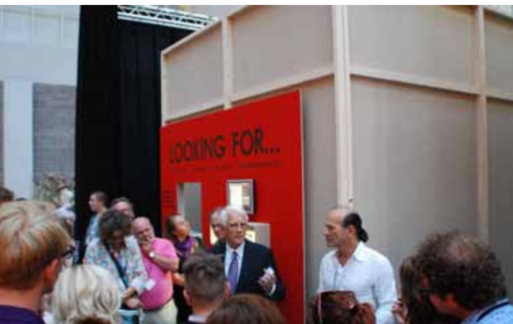
De Nederlandse ambassadeur in Tsjechië opent het Nederlandse paviljoen.