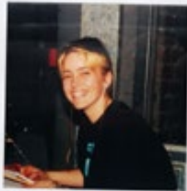
Aan de inspiërtenlesse naar in Reimscheid (DE)