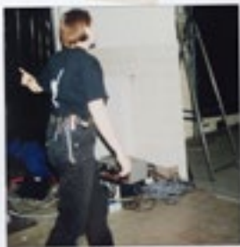
Locatievoorstelling in de oude Brandweerkazerne in Utrecht

voor de hand, maar er zijn genoeg andere beroepen, zoals de verpleging, met lange werkdagen en zwaar tillen. In de theaterwereld is juist de combinatie van technisch inzicht, overzicht in gecompliceerde situaties en sociale intuïtie, waarover veel meiden beschikken, aangevuld met de juiste dosis humor en lef, een prima