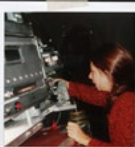
Met CCole Giustini met Lalala Human Steps op tournee