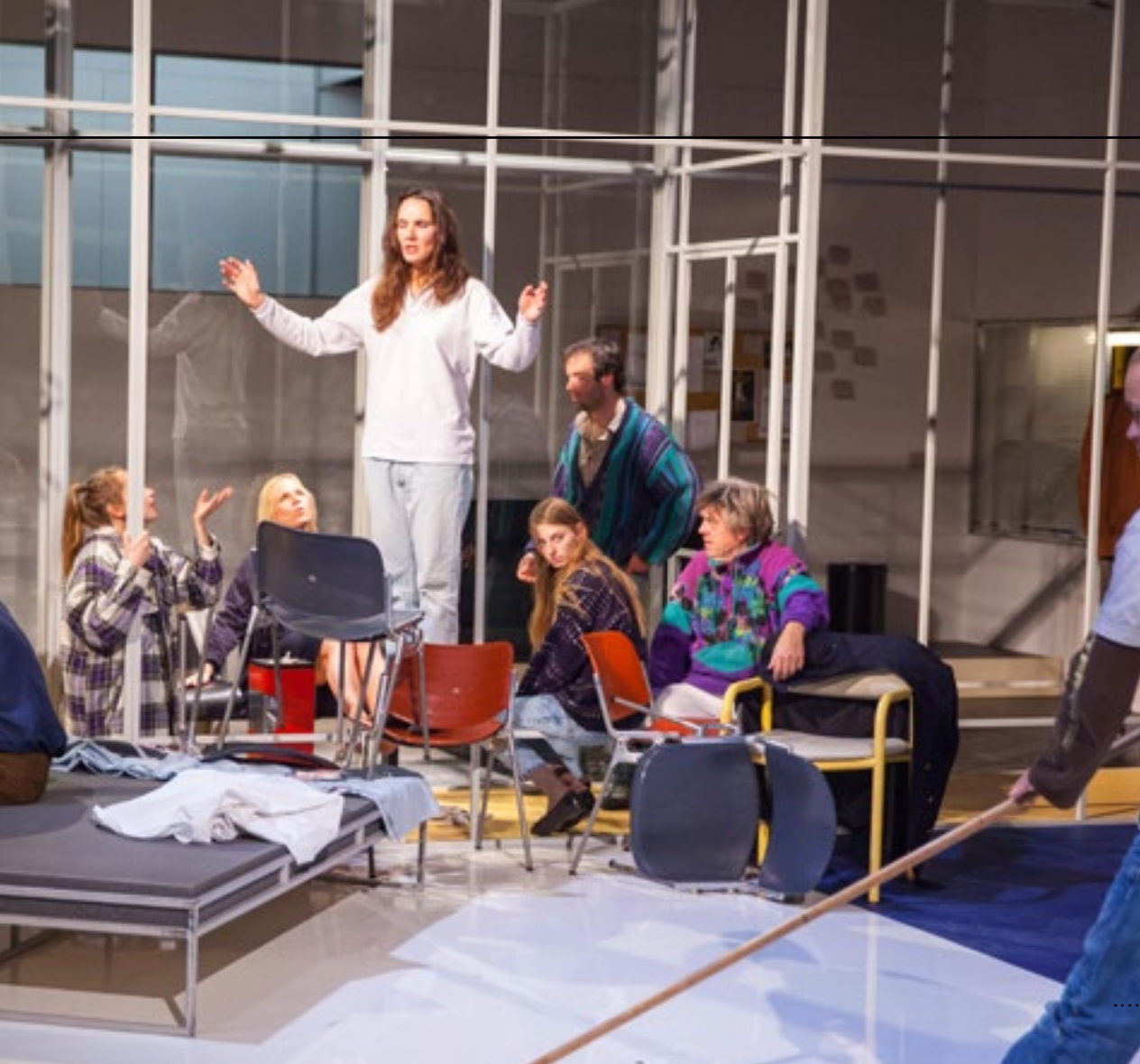
Theater Utrecht heeft voor decor een slim systeem ontwikkeld met standaardmodules en standaardframes, hier te zien in 'Een soort Hades'.