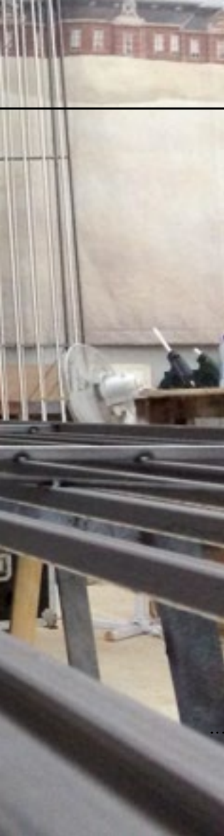
Drie technici monteren 2,5 km led-strip aan het decor van 'De revisor' van het Nationale Toneel.