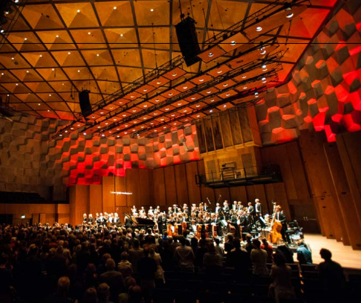
Het Noord Nederlands Orkest in de Grote Zaal van De Oosterpoort, waar al het hijsen draadloos wordt aangestuurd. Het plafond is zo ingericht dat alles apart naar beneden kan.