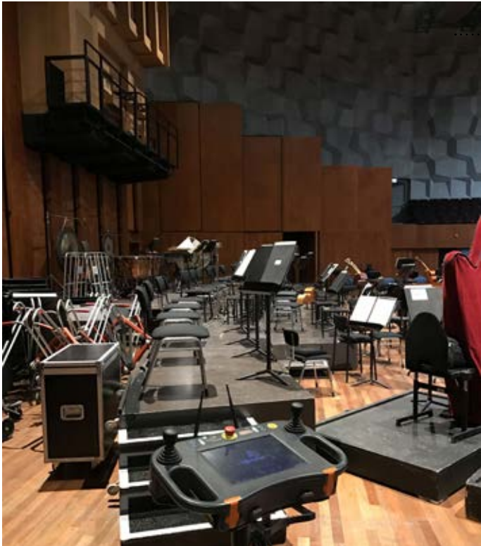
De console van de draadloze hijsinstallatie staat op een verrijdbare poot. "Maar als je even het podium op wilt, pak je het apparaat er zo van af."