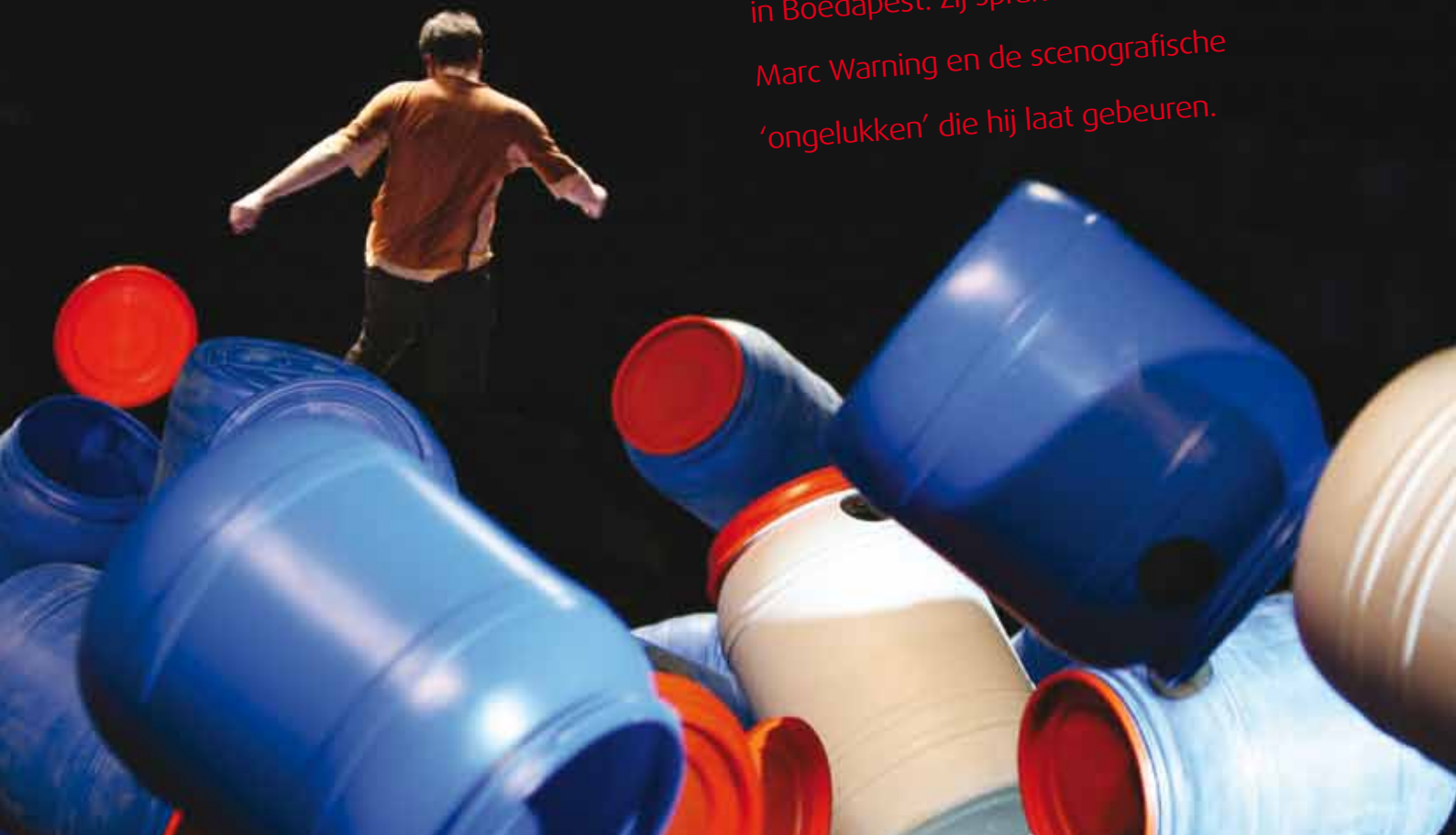
Voorraadtonnen storten op het podium in Van de brug af gezien, Toneelgroep Oostpool (2010).