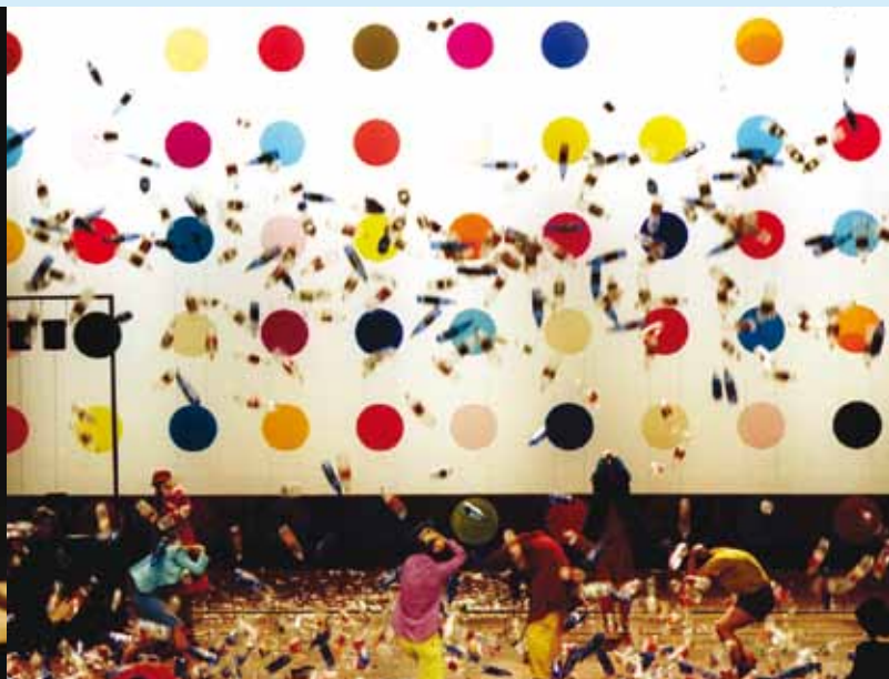
Een opblaasbaby en een regen van petflessen in Snaren van Toneelgroep Amsterdam (2002).

ongelukken kwam er in de tweede helft een 'wand' van transparante, gekleurde cirkels naar beneden, die vervolgens ten opzichte van elkaar gingen verschuiven, waardoor nieuwe vormen en kleuren ontstonden. Vergelijkbare ongelukken voltrokken zich in Van de brug af gezien . Hier zijn het de plastic voorraadtonnen, aanmerkelijk groter dan de petflessen, die naar beneden storten. Het effect is dreigend, zeker ook voor het publiek op de voorste rijen. Het zijn gebeurtenissen die zich steeds min of meer zelfstandig voltrekken en toch verschillen ze van elkaar. Snaren