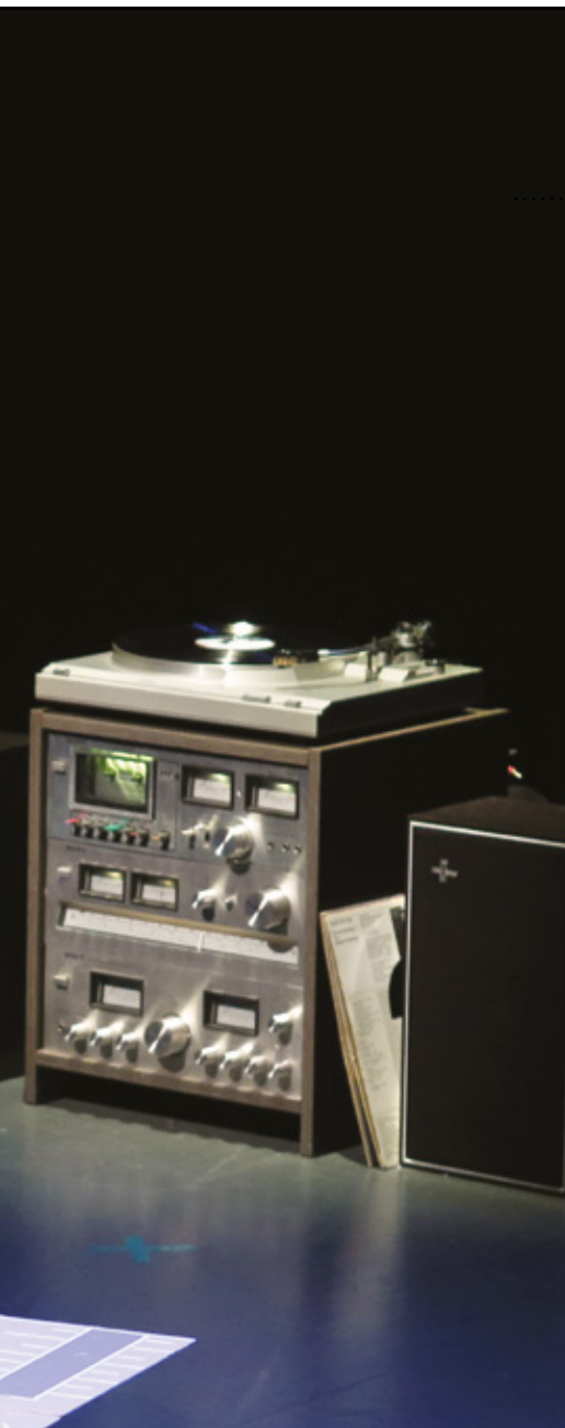
In de speakers van de stereotoren zijn actieve Mackie speakers ingebouwd om de hele zaal te bereiken