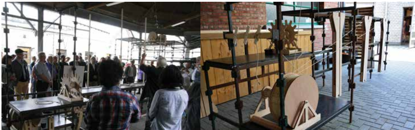
Met 1:4 schaalmodellen van de toneelmachinerie werd de werking gedemonstreerd.

internationaal de aandacht. Perspektiv, de associatie van historische theaters in Europa, nomineerde de toneelmachinerie van de Bourla als een van de zeven meest bedreigde locaties van cultureel erfgoed. Europa Nostra, de Europese erfgoedorganisatie die deze lijst samenstelt, bevestigde die status onlangs, wat reden was voor enige internationale ophef en dus voor het organiseren van een conferentie over historische theatertechniek. Het is natuurlijk leuk en interessant om te zien hoe theatertechniek er pakweg 150 jaar geleden uitzag, maar nog veel leuker en interessanter om te zien in hoeverre die