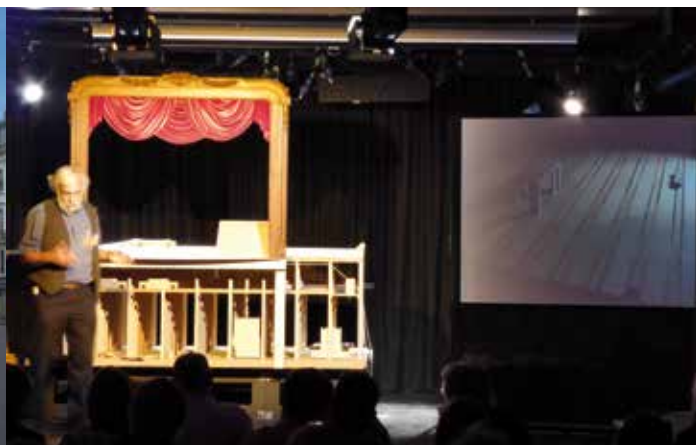
De Bourla schouwburg | FOTO: © STEFAN GRAEBENER | en presentatie door Jerome Maeckelbergh met 1:10 schaalmodel. | FOTO: © TORSTEN NOBLING |