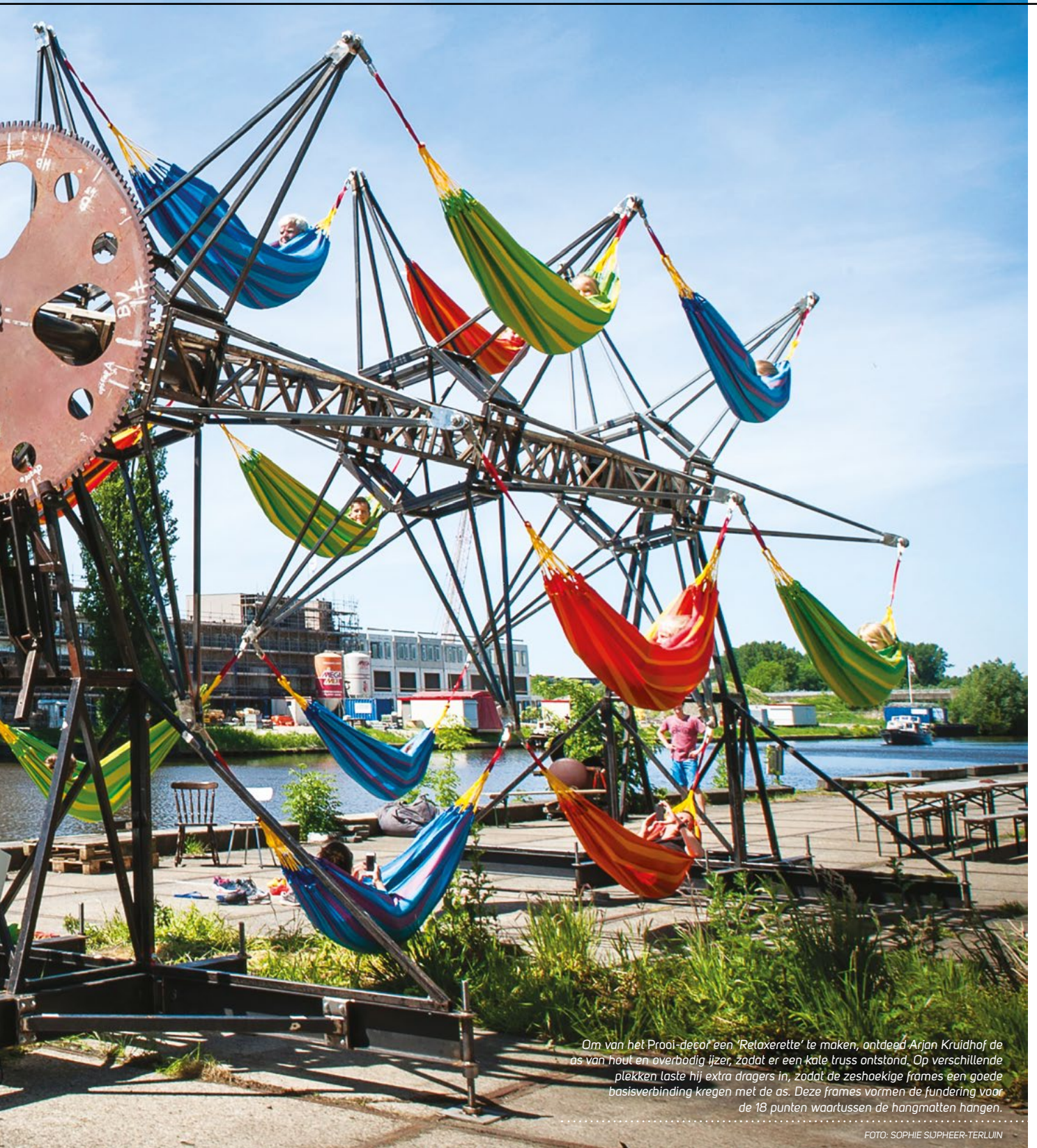
Om van het Prooi-decor een 'Relaxerette' te maken, ontdeed Arjan Kruidhof de as van hout en overbodig ijzer, zodat er een kale truss ontstond. Op verschillende plekken laste hij extra dragers in, zodat de zeshoekige frames een goede basisverbinding kregen met de as. Deze frames vormen de fundering voor de 18 punten waartussen de hangmatten hangen.