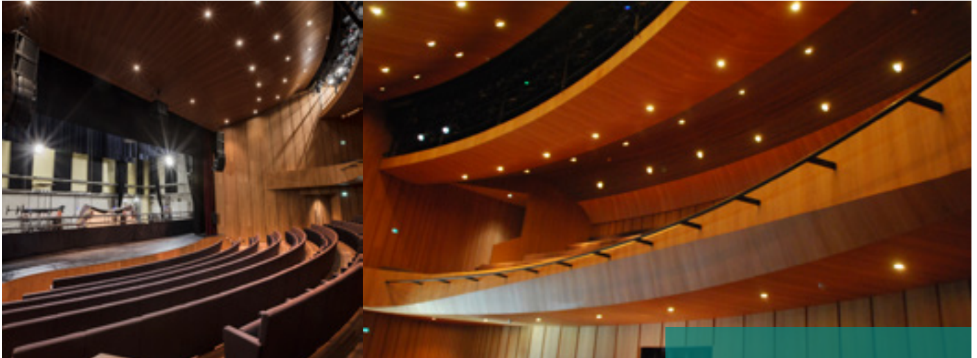
"Het basisidee van architect Oscar Vos was om de zaal te modelleren naar de binnenkant van een muziekinstrument"