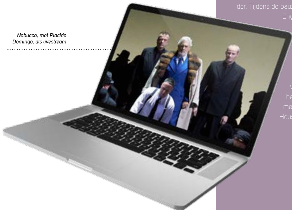
Nabucco, met Placido Domingo, als livestream

En die vertoonden we ook op het scherm. Veel kijkers lieten weten dat dit de eerste keer was dat ze een ballet hadden gezien – and they were hooked . De feedback van tevreden kijkers was voor ons een onmiddellijk bewijs van het succes van de samenwerking tussen The Royal Opera House en BP.