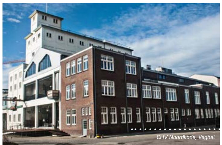
CHV Noordkade, Veghel