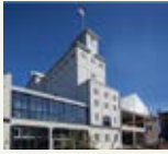
CHV Noordkade, Veghel

zaal, maar levert uiteindelijk een theatergebouw op, waarin de oude zaal weer een belangrijke plaats heeft gekregen.