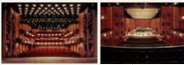
Beweegbaar plafond Theater De Spiegel, Zwolle