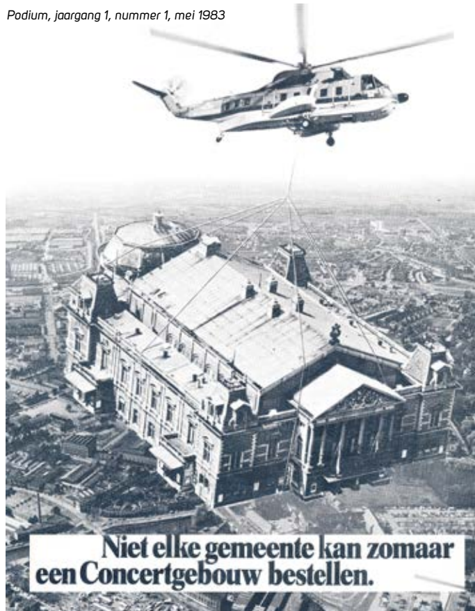
Podium, jaargang 1, nummer 1, mei 1983

stonden theaters speciaal voor kleinere gezelschappen. Er kwam ruimte voor jeugd-, marge- en vormingstheater met als gevolg meer voorstellingen en een gevarieerder aanbod. In die tijd speelde de Dogtroep op scheepshellingen in Amsterdam-Noord en het Werktheater koos zijn eigen omgeving. In 1980 startte Oerol op Terschelling. Het 'rodepluche-theater' was definitief uit.