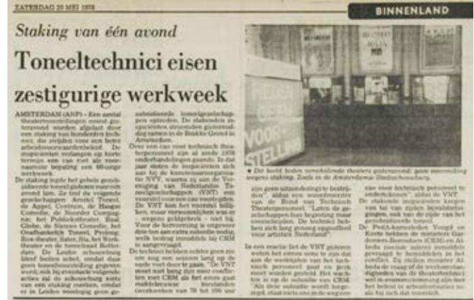
Leidsch Dagblad 20 mei '78: Staking theatertechnici

In 2016 werd daarom werkgroep VPT 2020 opgericht, die zich ging buigen over de vraag hoe de toekomst van de VPT eruit zou kunnen of moeten zien. Dit resulteerde in een rapport Bouwstenen voor Beleid .