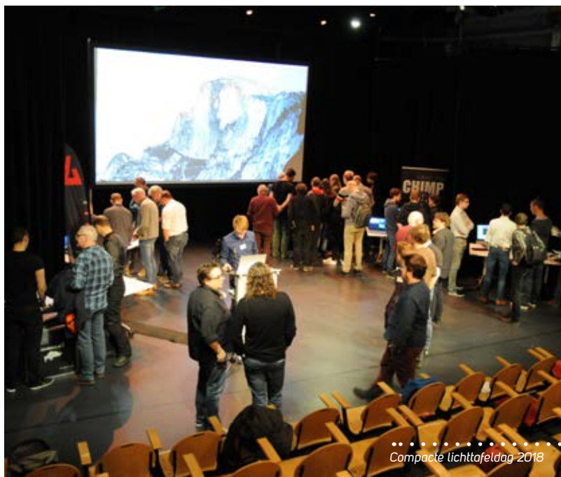
Compacte lichttafel dag 2018

Op verschillende fronten zijn activiteiten in gang gezet, zowel qua interne organisatie als in relatie tot bovenstaande aandachtsgebieden. Maar indachtig het credo 'Voor en Door Leden' nodigen we alle leden uit om over visie, missie en beleid van gedachten te wisselen tijdens de komende ALV op 8 februari aanstaande en hun steentje bij te dragen aan de uitvoering van het beleid. <<